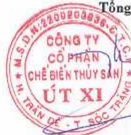
Lý Bích Quyên